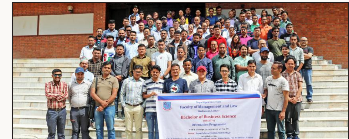
वि.सं. २०७६ वर्षे सत्र अभिमुखीकरण कार्यक्रम तथा सम्पर्क कक्षा

सम्पर्क फोन नं.: ०१-५००८०४७ (केन्द्रीय कार्यालय), पोष्ट बक्स नं.: २९६ ०१-५००८०४८ (व्यवस्थापन तथा कानून सङ्काय), ०१-५५२४१०८ (सामाजिक शास्त्र तथा शिक्षा सङ्काय) ०१-५५२४३०८ (विज्ञान, स्वास्थ्य तथा प्रविधि सङ्काय) ईमेल: info@nou.edu.np, वेबसाइट: www.nou.edu.np,