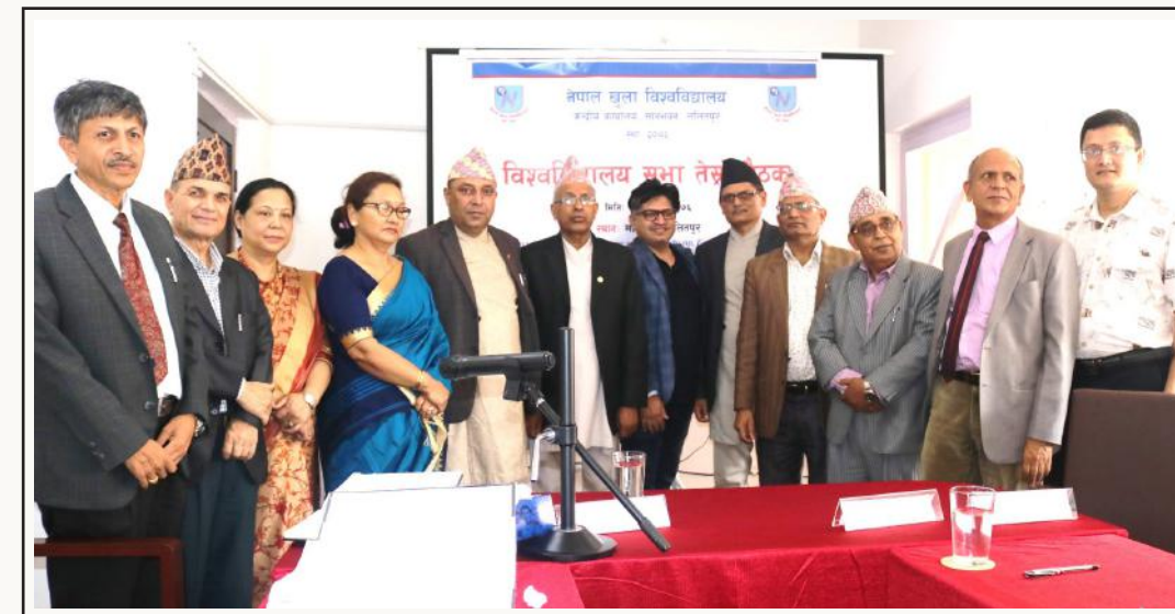
नेपाल खुला विश्वविद्यालय सभाको तेस्रो बैठक - २०७६ असार

• अभ्यास शिक्षण शुल्क/प्रयोगशाला शुल्क/स्थलगत अध्ययन शुल्क जुन सेमेष्टरमा सो कार्य गर्नुपर्ने हुन्छ सोही सेमेष्टरमा भुक्तान गर्नुपर्ने हुन्छ ।