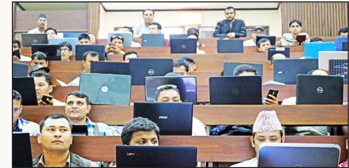
वि.सं. २०७४ हिउँदे सत्र प्रथम अभिमुखीकरण कार्यक्रम तथा सम्पर्क कक्षा